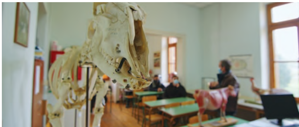
ΕΙΔΙΚΟΤΗΤΑ 1: ΔΙΑΧΕΙΡΙΣΤΗΣ ΣΥΣΤΗΜΑΤΩΝ ΕΚΤΡΟΦΗΣ ΑΓΡΟΤΙΚΩΝ ΖΩΩΝ

Στις εγκαταστάσεις της Αβερώφειου Γεωργικής Σχολής Λάρισας, σε ένα περιφραγμένο αγρόκτημα 40 στρεμμάτων με συγκρότημα 43 διατηρητέων κτηρίων, ανάμεσά τους και το εμβληματικό κτήριο της βιβλιοθήκης, το ΙΕΚ συνεχίζει την υπερεκατονταετή εκπαιδευτική ιστορία της Σχολής και λειτουργεί στον χώρο με σύγχρονες δομές εκπαίδευσης και κατάρτισης σπουδαστών για δύο ειδικότητες, που περιλαμβάνουν εργαστήρια γεωργικών μηχανημάτων και μηχανολογίας, καθώς και βουστάσιο, χοιροστάσιο, πτηνοτροφείο και καλλιεργήσιμους αγρούς.